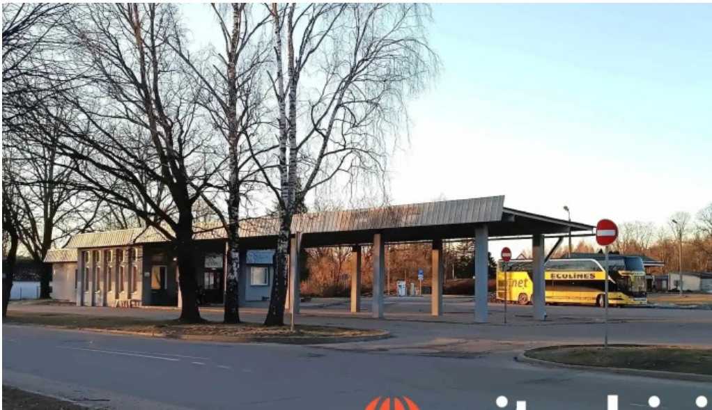
Rujienas autoosta visi