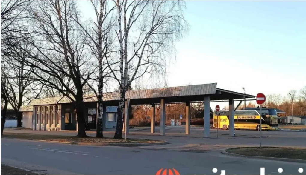
Rujienas autoosta r?jiena