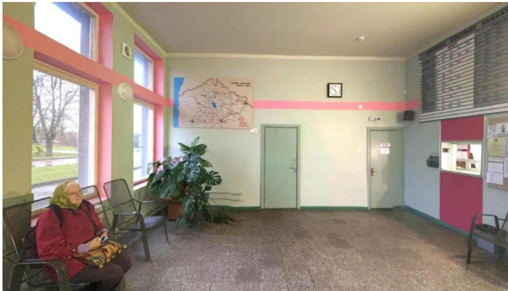
Rujienas autoosta ielas attels un 360deg