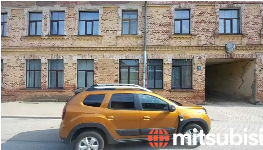
Rujienas autoosta videoklipi